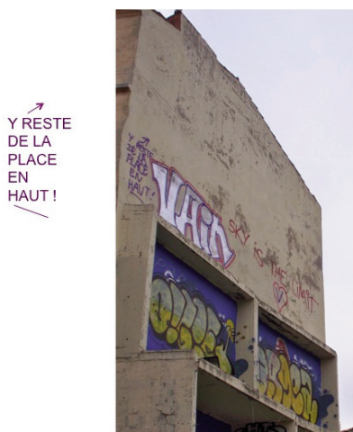
Fig. 2: VAIN, Marseille, 03.2016 © Thiburce

serait une limite de la vie en cours ici-bas . On observe là une pratique du graffiti qui exhibe ses propres limites tout en cherchant à les dépasser 5 . Par son surplomb vis-à-vis des peintures en contrebas et sa superposition à l'enduit de l'immeuble, les limites de l'espace et du temps de représentation prennent corps. Dans un mouvement opposé et complémentaire, on voit à gauche de cette inscription le pseudonyme d'un graffeur (VAIN) dont les contours sont en rouge et violet et le remplissage en couleur chrome.