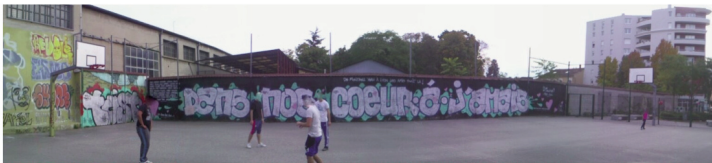
Fig. 4 : DANS NOS CŒURS À JAMAIS

La figure 4 ci-dessous représente une pièce de plusieurs mètres réalisée par des graffeurs et d'autres personnes (dont les noms sont écrits à l'extrémité gauche), en hommage et en mémoire à une amie décédée (dont le nom est écrit à l'extrémité droite, souligné de cœurs roses) ; cette pièce vient en contrepoint du vide et de l'oubli de la perte de la personne aimée. En fonction de la personne qui s'en fait l'expérience, ce graffiti peut avoir plusieurs statuts, selon la typologie peircienne du signe. Pour chacune des personnes ayant participé à son écriture, il peut avoir une valeur de trace de l'événement d'inscription et celui de la perte. Pour les usagers de l'espace public qui ne connaîtraient pas l'amie en question, il peut avoir une valeur d' icône . Aussi, ce graffiti peut revêtir une valeur de symbole à la fois de l'amour contre le passage du temps (« à jamais ») et de la dimension éphémère de la vie (un memento mort ) pour chacun qui s'est fait l'expérience (in)directe de la perte d'une personne chère.