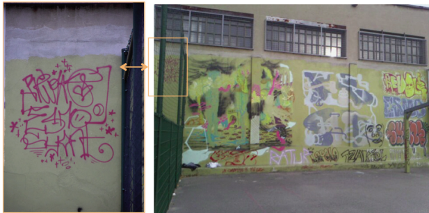
Fig. 5: Une signature pour trait d'union ©Thiburce

Cette figure 5 est constituée de deux photographies prises à Villeurbanne 13 représentant une série de graffitis réalisés à l'intérieur du terrain de basket qui apparaît en figure 4. Sur la photographie de droite, on trouve deux pièces au centre, faites par REVOLTE et ESMO et, à leur droite, trois noms tracés les uns aux dessus des autres : REVOLTE (en jaune et rouge), ESMO (en bleu), SYONE (en rouge et bleu). Sur la photographie de gauche, on voit tracés de haut en bas les noms REVOLTE, ESMO et SYONE d'un seul trait, d'une même couleur et d'un seul mouvement. Cette signature est réalisée par l'un d'entre eux seulement.