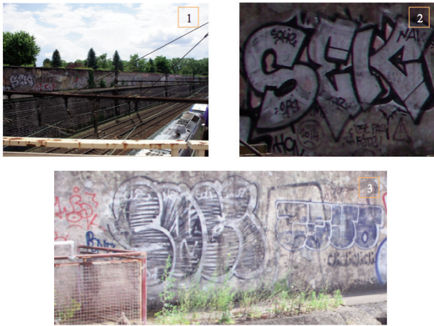
Fig. 6: Un lieu « ancestral »

de l'autre de ces murs, dans une temporalité particulière. Les photographies de la figure 6 ci-dessous ont été prises depuis une route sous laquelle passe une voie ferrée, comme on le voit en photographie 1. Elles sont un instantané d'un lieu qualifié d'« ancestral » pour la réalisation de graffitis à Lyon 14 . D'un point de vue étique (Pike 1967), un tel mot pourrait sembler paradoxal et inapproprié au vu des dates où certains d'entre eux ont été réalisés – 2014 pour le graffiti de SEK dans la photographie 2 et 2007 pour le lettrage de SOLI (en noir) en photographie 3. Néanmoins, d'un point de vue émique ( Idem ), cette expression éclaire cette ambivalence en jeu dans la temporalité de la pratique, des expériences vécues et des traces qui subsistent.