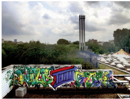
Fig. 7: Original Wild Tony Style ©Kactus 43

Dans un autre mouvement, on peut questionner la place de sa propre présence dans l' ici et maintenant en rapport à une énonciation passée. On peut enquêter ce mouvement par la figure 7 ci-dessous, une photographie prise à Berlin en juillet 2015, dans le quartier de Kreuzberg.